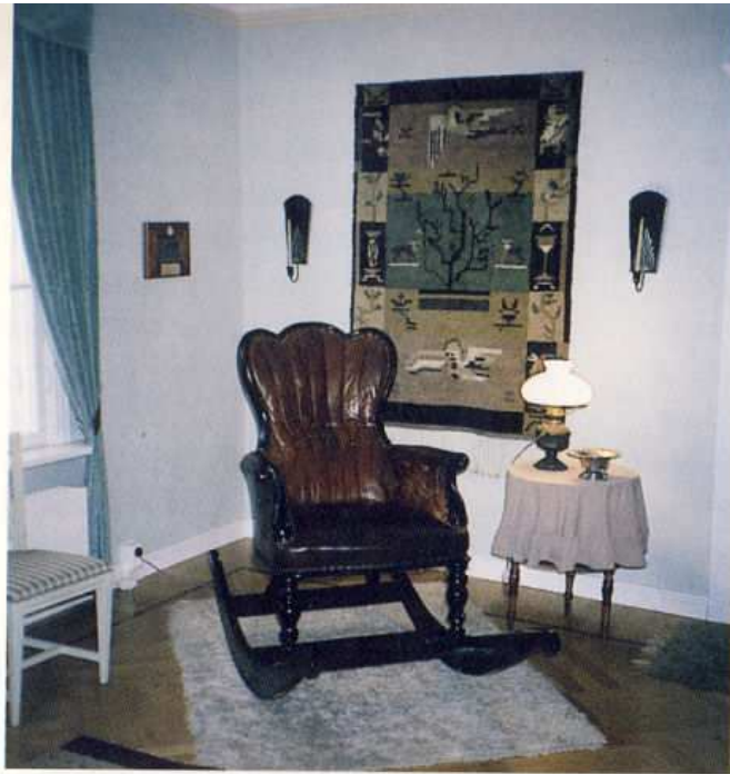
Mäntsälän kartanon vanha keinutuoli.