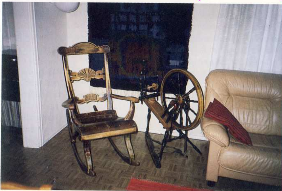
Morsiämen keinutuoli ja rukki.